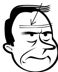
קימט את מצחו