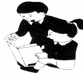
הספר שלהם = ספרם

שימו לב ! אח שלו = אָחיו, אבא שלו = אָביו, פּה שלו = פּוּו